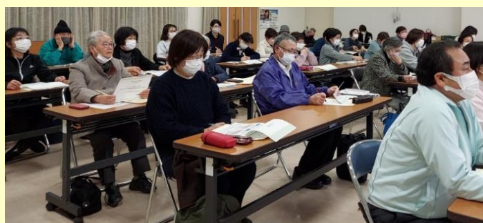
柳井市文化福祉会館