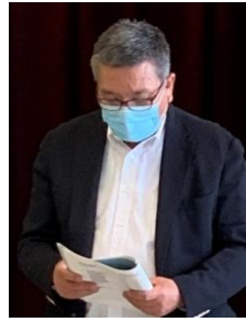
第3号議案提案（吉光役員推薦委員長）