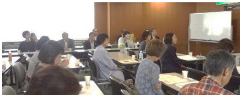
第10回消費者ネットやまぐち通常総会（労福協会館）

※議決権をもつ正会員数116人中、実出席16人、書面議決書74人、計90人（採決時）