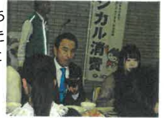
「YPU TFT project」と村岡県知事

TFTの支援先の1つであるフィリピンの郷土料理「アドボ」を日本風にアレンジ。副菜は山口県オリジナル野菜のはなっこりーや有機栽培のピーナッツを使用。デザートには、フィリピンの市場で大人気のバナナトロン（春巻き）を再現したメニューでした。食べることでフィリピンの郷土料理を知ることができ、途上国の子どもたちに少しでも支援ができ、地産地消、環境に配慮したエシカルなメニューを頂きながら、周りの方たちとSDGsについて話すことも出来ました。